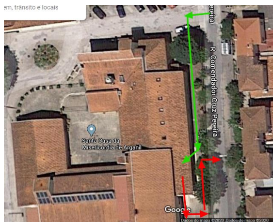
Figura 1 - Opção 1