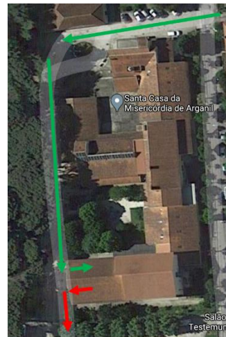
Figura 2 - Opção 2 (visitas específicas)